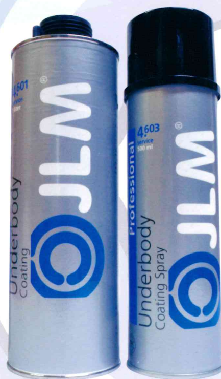
専用ガンタイプ仕様 スプレー缶タイプ仕様